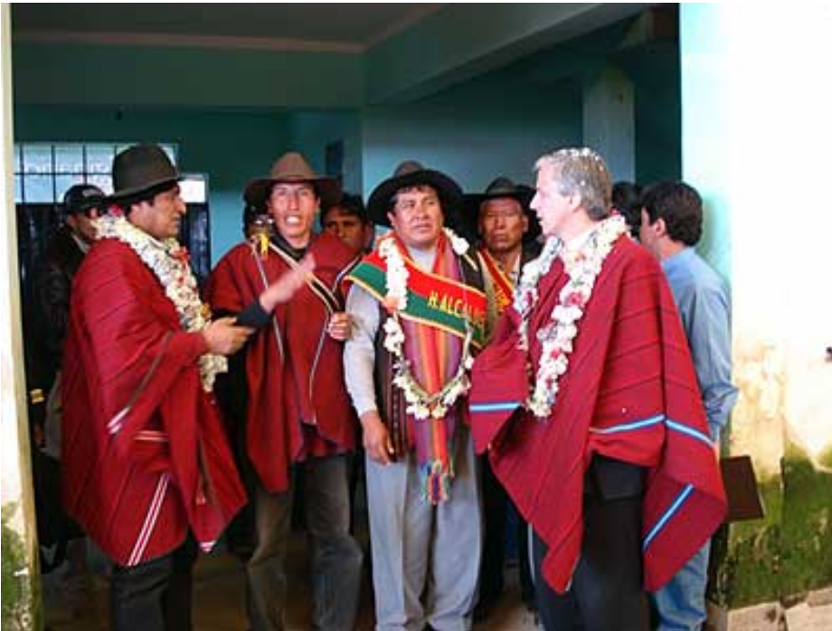
Figura 5: El Presidente Evo Morales (a la izquierda) y el vicepresidente García Linera (a la derecha) en una reunión con los líderes de los Ponchos Rojos y usando la ropa simbólica que identifica al grupo.

Los miembros del grupo han recibido un estatus semi oficial con el gobierno, han desfilado con los militares, y han estado visibles en muchas de las confrontaciones con la oposición política.