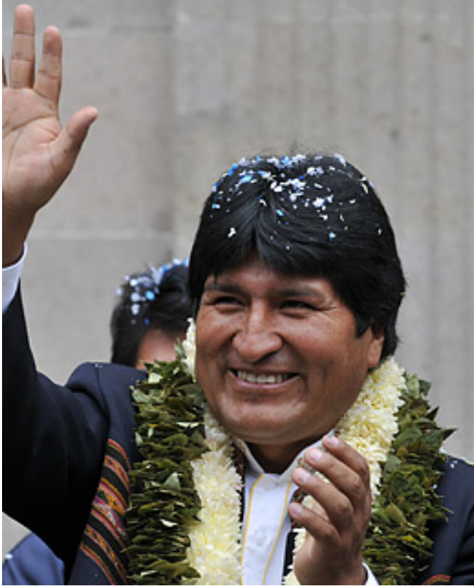
Figura 1: Presidente Boliviano Evo Morales

Esas promesas se han roto casi desde el principio del gobierno del MAS, llevando a Bolivia a su peor crisis política desde el retorno a la democracia duramente peleado en 1982. Morales recientemente se autoproclamó un “Marxista Leninista,” oscureciendo aún más las perspectivas de desarrollar una estructura política pluralista y tolerante. 2 Y a pesar de que el gobierno se ha autoproclamado nacionalista y en contra de cualquier injerencia extranjera, los extranjeros pocas veces han ejercido más influencia de la que tienen ahora—desde aquellos intelectuales Españoles que ayudaron a escribir la nueva constitución 3 y doctrina militar, a la presencia significativa de asesores militares y gubernamentales Venezolanos y un involucramiento directo en la creación de los padrones electorales, a la presencia Cubana e Iraní en las estructuras de inteligencia y en la actividad económica. El gobierno de Morales también ha permitido lazos formales e informales con las Fuerzas Armadas Revolucionarias de Colombia (FARC) designadas como una entidad terrorista y narcotraficante por los Estados Unidos y por la Unión Europea. 4 Las relaciones entre