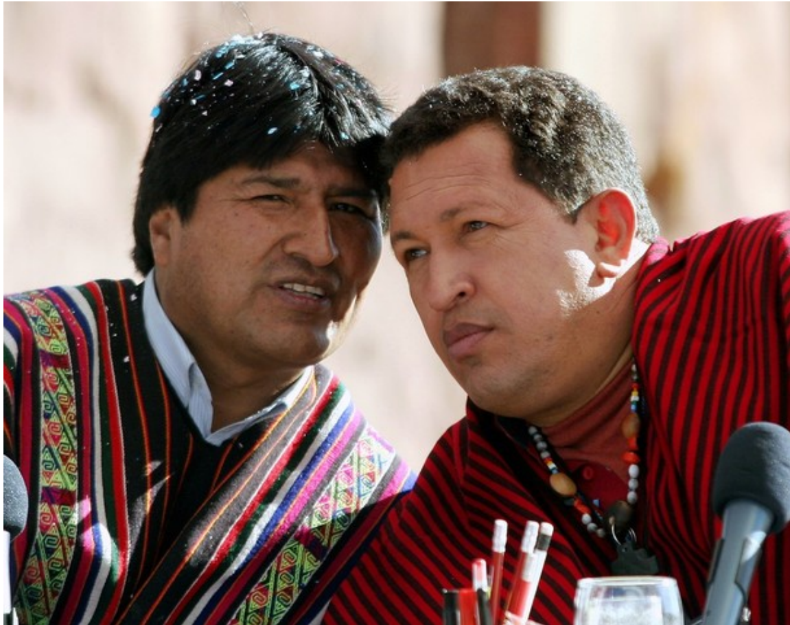
Figura 3: Evo Morales de Bolivia y Hugo Chávez de Venezuela se consultan.

tal como la “renacionalización” de las industrias de hidrocarburos. Más bien pretende enfocar los hechos que representan un peligro significativo no solo para el país y su supervivencia, sino que para la región y para los Estados Unidos.