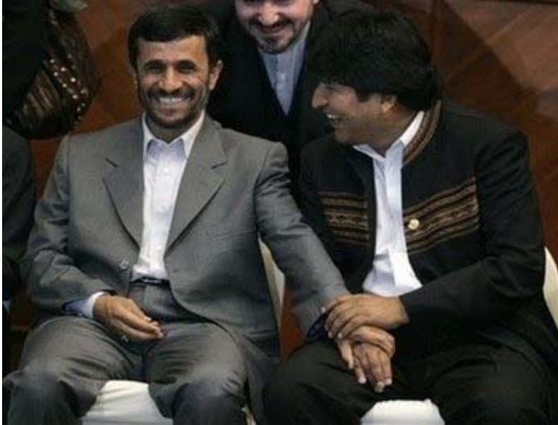
Foto 6: El presidente Iraní Ahmadinejad (izquierda) y el presidente Boliviano Evo Morales (derecha), durante la visita de Ahmadinejad a La Paz.

Durante su visita a La Paz en el 2007, Ahmadinejad prometió a Bolivia una ayuda de $1.1 mil millones durante cinco años. 81 Uno de los acuerdos más publicitados fue que Irán iba a construir una emisora de televisión en el Chapare, con el objetivo de cubrir a toda la América Latina. Morales dijo que la emisora convertiría a Bolivia en “el centro de la revolución democrática” y ayudaría “a apoyar la lucha campesina en América Latina.” 82