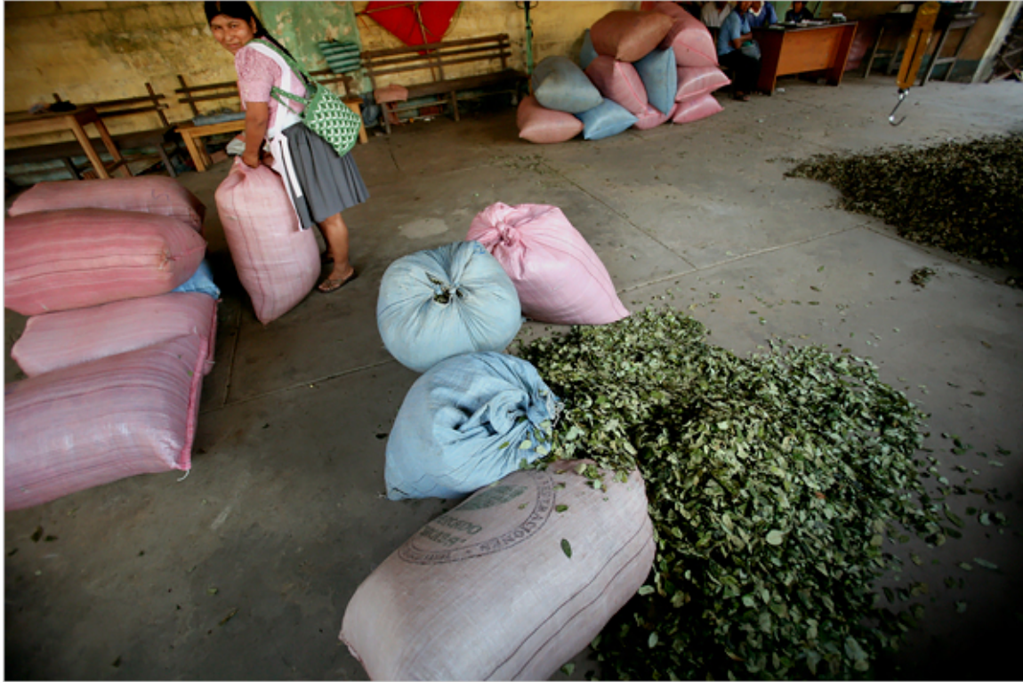
Figura 4: Coca para la venta en el Chapare