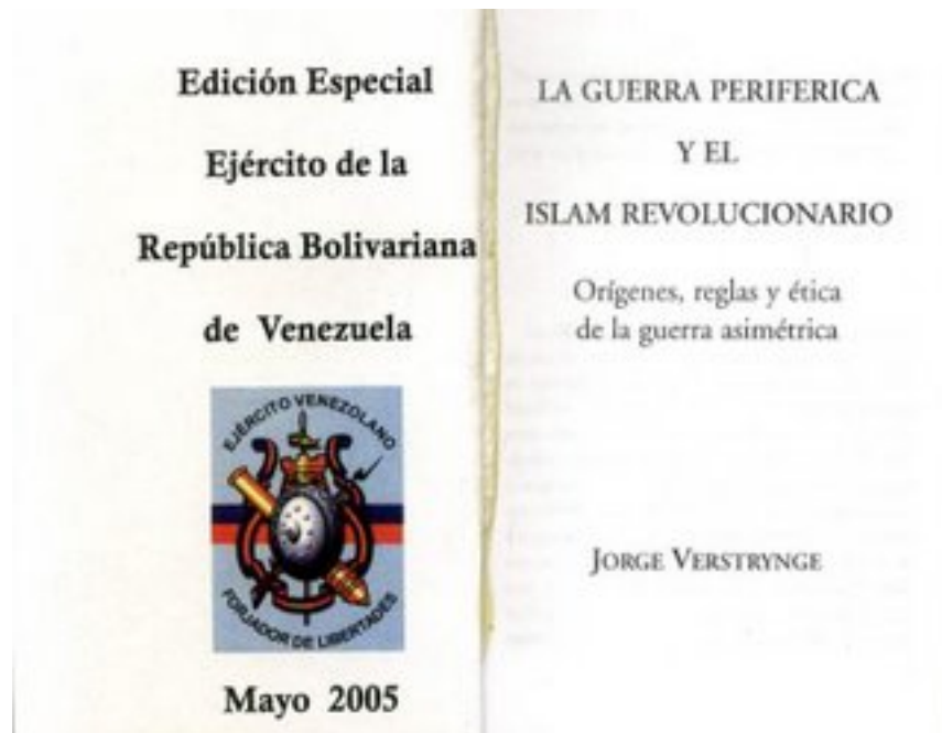
Figura 8: Una copia de la edición especial versión tamaño de bolsillo del trabajo de Verstrynge, distribuido al cuerpo de oficiales Venezolanos.

una edición especial de bolsillo del libro a ser impreso y distribuido a través del cuerpo de oficiales con órdenes explícitas de que fuese estudiado de principio a fin. En una entrevista del 12 de diciembre del 2008 en la televisión del estado de Venezuela, Verstrynge alabó a Osama bin Laden y a al Qaeda por crear un nuevo tipo de guerra que es des-territorializada, des-estatizada y des-nacionalizada, “una guerra en la que los terroristas suicidas actúan como “bombas atómicas para los pobres.” 106